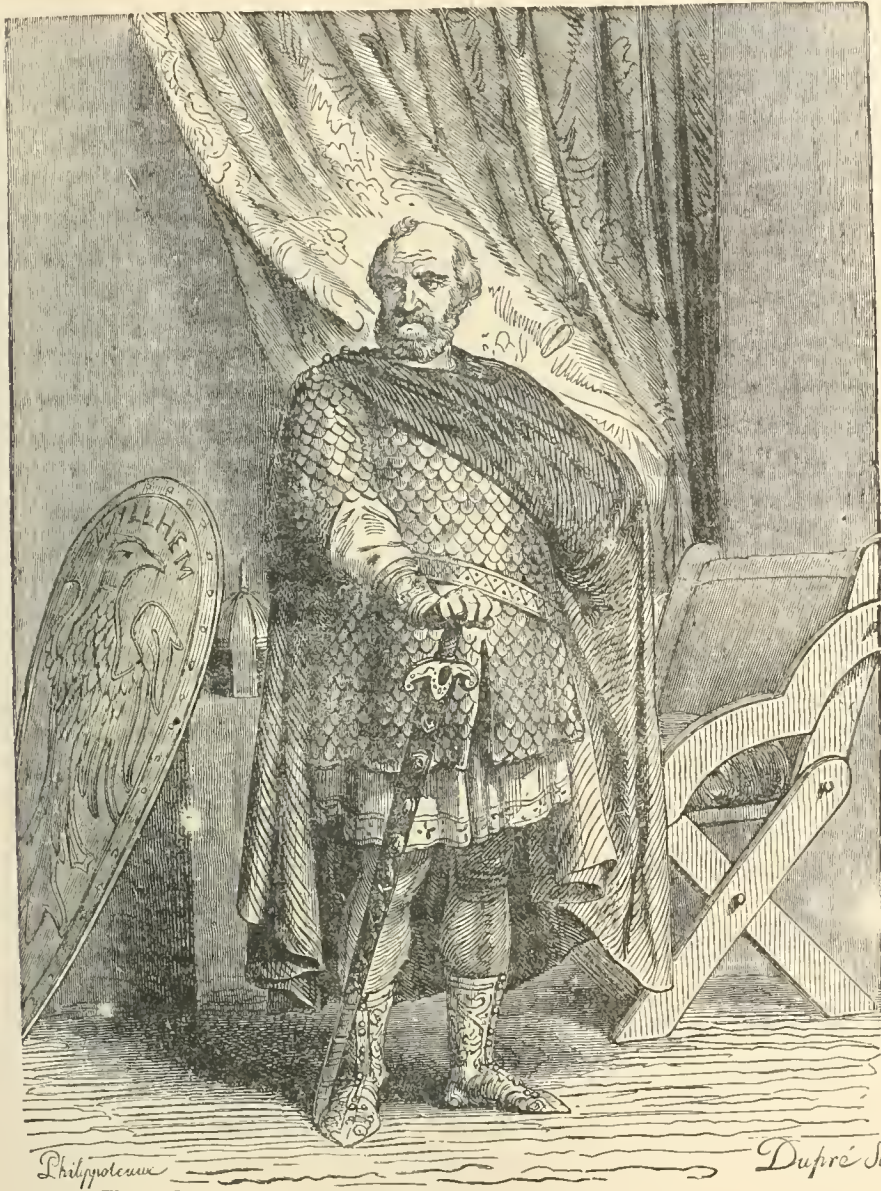
Guillaume le Conquérant.

ultérieures avec le duc de Normandie, ses entretiens particuliers avec les Normands restés auprès de sa personne, sont la partie secrète de cette histoire. Tout ce que disent les chroniques du